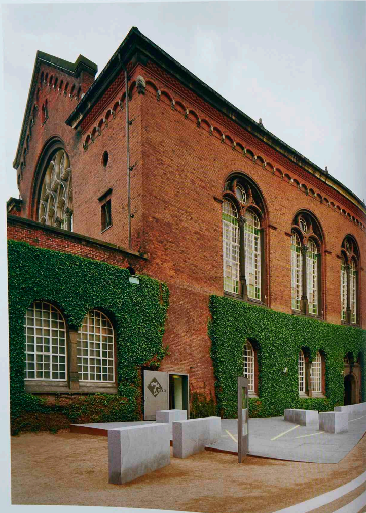
Judiska museet i Köpenhamn ligger i Det Kongelige Bibliotek. Entrén med avsåts i terrazzo. Föregående uppslag: Daniel Libeskind. Nästa uppslag: museets ljudtejer avspeglar sig i ett porträtt av en framstående dansk judisk familj (vänster); 1600-talsinteriören har klätts in i väggar i björkfäner.

Han fakturerar dryga 2000 kronor i timmen. Han omsätter 45 miljoner kronor. Han till och med stoppas på stan ibland och får skriva autografer.