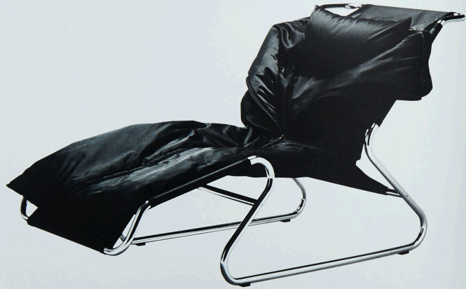
BDRelax (2000), Cbi.